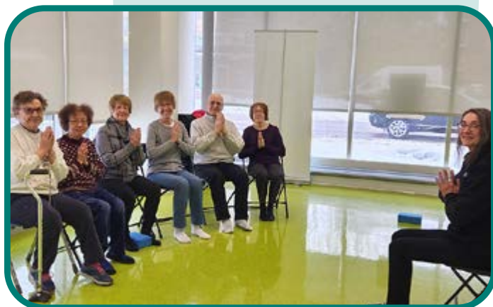
YOGA SUR CHAISE